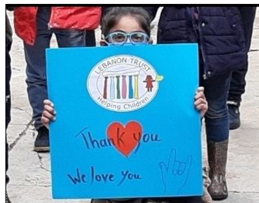
Sopra: un messaggio dagli alunni del FAID: "Grazie Lebanon Trust, vi vogliamo bene"