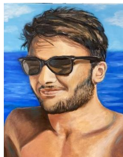
Dipinti realizzati su commissione da una volontaria e venduti per raccogliere fondi

Le vostre donazioni possono essere inviate online o tramite bonifico bancario.