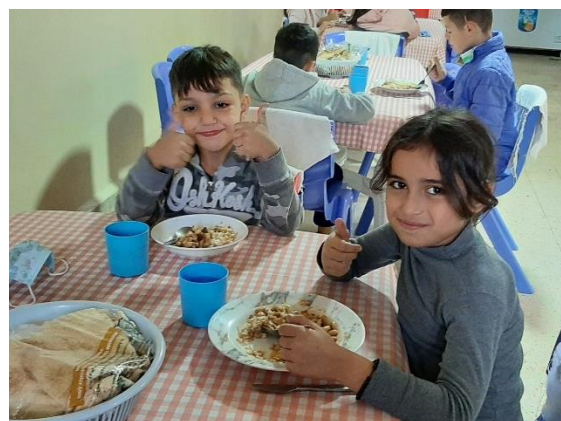
Vita alla scuola: in classe durante le lezioni e a pranzo

Quest'anno siamo riusciti a mandare un po' di più dell'anno scorso, ma purtroppo la nostra raccolta di fondi non ha coperto l'intera somma. È stato comunque incoraggiante vedere che tanti amici sono molto generosi. Grazie!