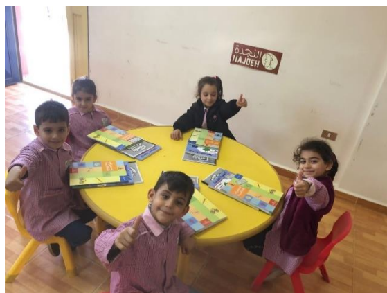
I bambini di famiglie rifugiate con i libri finanziati da Lebanon Trust