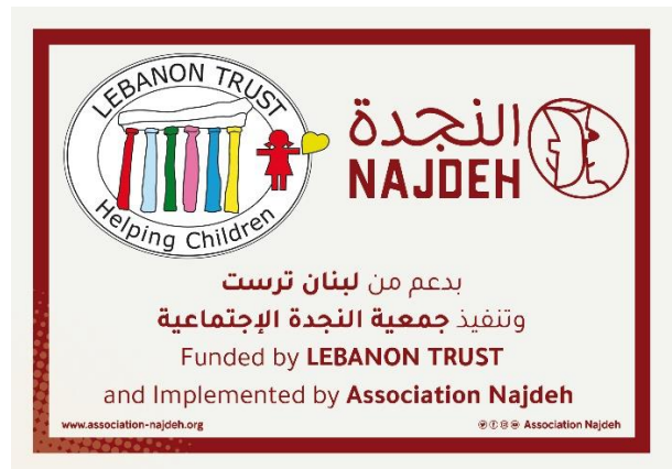
Distribuzione di pacchi-viveri nei campi rifugiati, finanziati da Lebanon Trust e preparati dall'Ass. Najdeh

Quest'anno pensavamo che raccogliere fondi fosse veramente una strada in salita. Un amico irlandese ha raccolto la sfida, letteralmente, scalando non una ma tre montagne tutte nello stesso giorno per beneficenza, raccogliendo 4mila euro per i nostri progetti! Altri hanno organizzato serate di Bingo e raccolte di fondi per strada; un'amica ci ha donato parte della sua liquidazione, una pittrice dilettante ha venduto ritratti di gatti, e tanti hanno donato, in silenzio e generosamente. A tutti, un enorme GRAZIE.